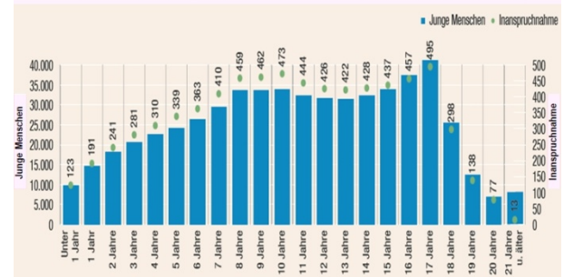
Abb. 1: Häufigkeiten von Erziehungshilfen nach Alter 2

Junge Menschen in den Hilfen zur Erziehung (einschl. der Hilfen für junge Volljährige) nach Altersjahren (Deutschland; 2016; andauernde Hilfen am 31.12.; Angaben absolut; Inanspruchnahme pro 10.000 der altersgleichen Bevölkerung)